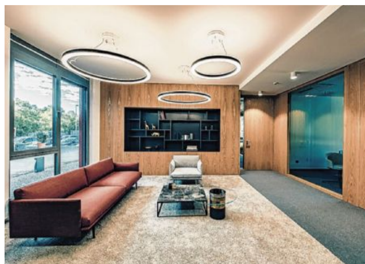
Das neue Beratungszentrum in Wasseralfingen.